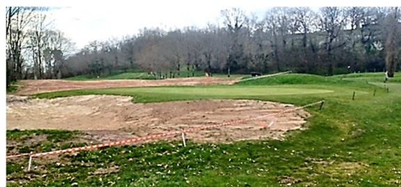
Diminution et remodelage du bunker côté ruisseau

D'autres interventions sont prévues tout au long du mois de mars, notamment sur les bunkers de fairway des trous n°9 et n°2, afin d'améliorer à la fois l'esthétique du parcours et le confort de jeu des golfeurs.