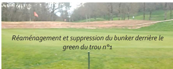
Réaménagement et suppression du bunker derrière le green du trou n°1

En ce début de mois de mars, les jardiniers, accompagnés du service des Espaces verts, poursuivent les travaux d'aménagement des bunkers, comme ici autour du green n°1. Le bunker situé derrière le green va être supprimé afin de simplifier l'entretien et améliorer le jeu. Celui situé à gauche sera, quant à lui, réduit de moitié puis entièrement réaménagé pour mieux s'intégrer au parcours.